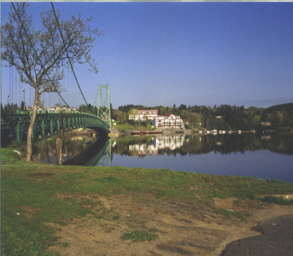
Grand-Mère, près de la résidence du Maître