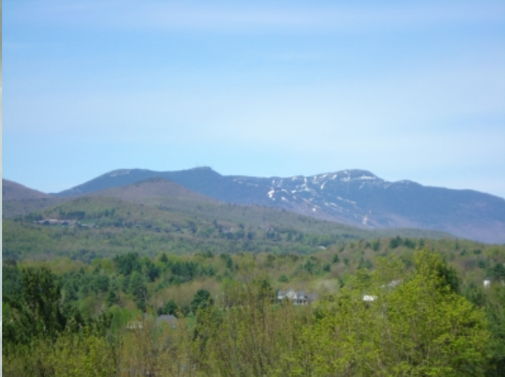
Le panorama du mont Mansfield près du Centre du Maître

occupé à penser à la manière dont je m'en tirerais lorsqu'il finirait son long monologue. Aussi, dès sa formule de fermeture, comme nous en étions au printemps avancé, je me précipitai à l'extérieur, sans demander mon reste. Et je me retrouvai hébété sur le balcon de l'entrée du pavillon. Je cherchais mes clefs de voiture dans mes poches quand je réalisai que j'avais fait le voyage avec mon amie et que j'avais laissé cette dernière à la maison. Et comble de malheur, je me retrouvais en ces lieux pour toute une fin de semaine, pour laquelle j'avais déjà payé les frais. Que faire! Je me penchai sur la rampe,