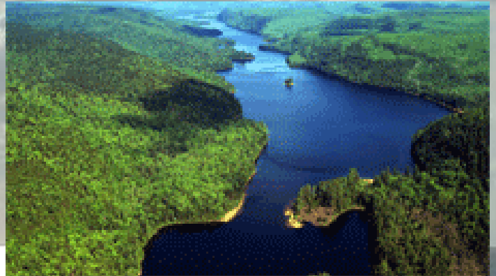
La majestueuse rivière St-Maurice, près de Grand-Mère

Pour résumer brièvement ce que cet homme a représenté, au Québec, pour plusieurs générations, on doit dire qu'il savait se présenter, selon le besoin, comme un père ou comme une mère, tellement on sentait ses polarités équilibrées et grande sa capacité d'adaptation. Lorsqu'il répétait comprendre que l'Amour peut tout et qu'il fonde tout les sens de la vie, il savait l'illustrer en agissant constamment, mais sans effort, comme modèle. Rempli de compréhension et de compassion, il savait se laisser toucher par le faible et le malheureux, comme il savait se faire grave et sévère avec les plus forts pris en flagrant délit de relâchement ou de délinquance. Il a toujours invité à vivre et à laisser vivre en répétant : Évitez de juger, mais apprenez à vous mêler des vos affaires, à