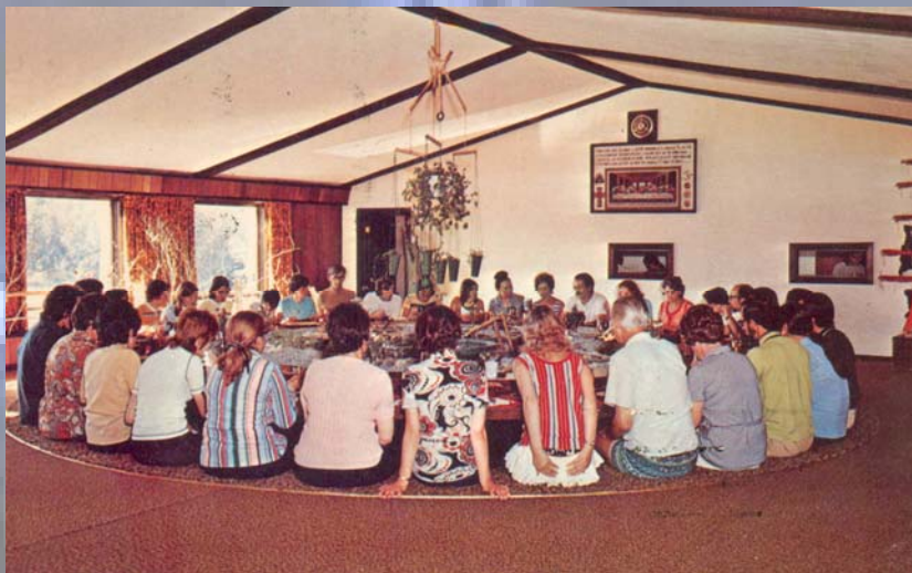
La salle principale du Centre du Maître, le Yogi Inn

Nerveusement ébranlé, à cause de ma timidité innée et de ma réserve habituelle, je fus pris d'un rire hystérique, entrecoupé de gloussements étranges, qui se prolongea tout au long de la conférence, soit plus d'une heure. J'avais beau tenter n'importe quoi, pour me distraire, je repartais à rire comme un débile, malgré les protestations de ma compagne. Pour des raisons de convenances, pris de malaises, je ne parvenais pas à me lever et à sortir de la salle. Je ne crois pas avoir retenu grand-chose du message du Maître, trop