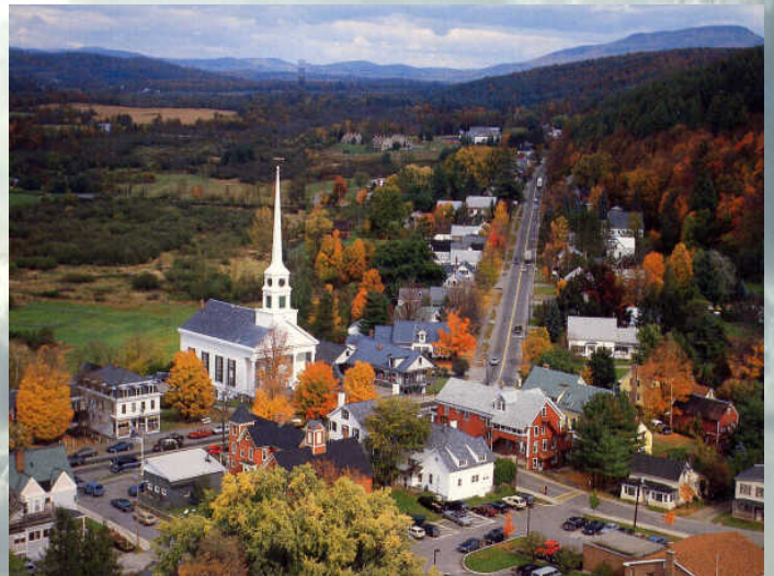
Le village de Stowe, l'automne, près du Yogi Inn

Suite à des échecs cuisants, après avoir été exploité dans sa candeur par des intimes et après avoir mesuré l'ampleur de la résistance du clergé, il décida qu'il n'avait plus rien à apprendre de la vie en incarnation. Alors, il alla se jeter devant un camion, sur une route