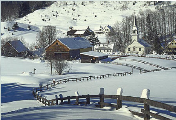
La célèbre station touristique de Stowe, l'hiver.